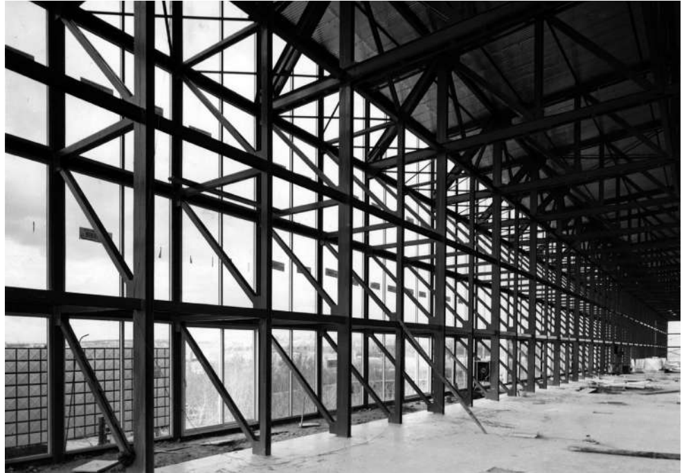
Fig. 15. Capilla de la Feria Nacional del Campo (Madrid, 1948). Arquitectos: Francisco Cabrero y Jaime Ruiz. Fotógrafo: Férriz. © Familia Férriz. AGUN/273.