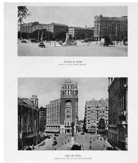
Fig. 4. Fotografía de la corredera Baja de San Pablo de Madrid (ca. 1929) publicada en el libro Memoria: Información sobre la ciudad. Año 1929 (Ayuntamiento de Madrid, Madrid, 1929). En RODRÍGUEZ SALMONES, Cristina (Coord.), Imágenes de Madrid. Fondos fotográficos del Museo Municipal , Ayuntamiento de Madrid, Madrid, 1984, p. 97.

Nos encontramos así ante un inexplorado archivo familiar privado de fotografía, un caso sin duda significativo para reconstruir los perfiles de la práctica profesional de la fotografía del siglo XX en España, sus técnicas y sus equipos. Como ocurre en el caso de Pando –un